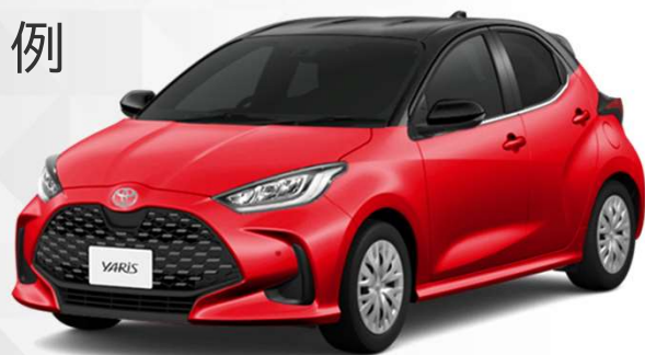
ヤリスHEV M15A(1.5Lエンジン) 使用オイル (GLV-1 0W-8)の場合